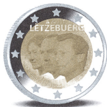
Thème Economie & Finances