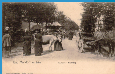
Bad Mondorf les Bains