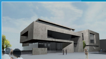
Bureau d'architectes COEBA / A.C. MONDORF

Toute la journée, marché dans les rues de Mondorf-les-Bains.