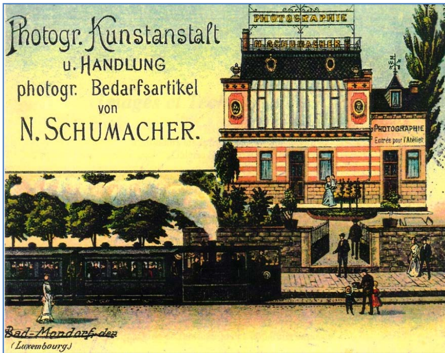
Bildteil einer Werbekarte für die Photographische Kunstanstalt von Nicolas Schumacher - mit dem Jhngeli, der Schmalspurbahn, auf dem Weg nach Luxemburg-Stadt.

Haus und Atelier waren, gegenüber der Straße, etwas zurück gesetzt. Die Rückseite des Hauses lag gleich an der Gander.